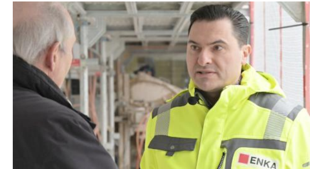
Handwerk - Profit steigern und fit für die Zukunft machen