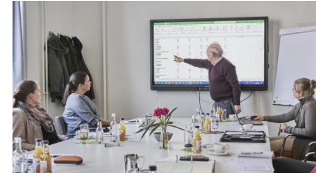
Personalmanagement - ein wichtiges Beratungsthema

Hier einige Beispiele für Beratungsprojekte, die wir in der letzten Zeit durchgeführt haben. Sie geben Ihnen einen Einblick in die Vielfalt der Aufgabenstellungen. Vielleicht finden Sie sich in dem ein oder anderen Beispiel wieder.