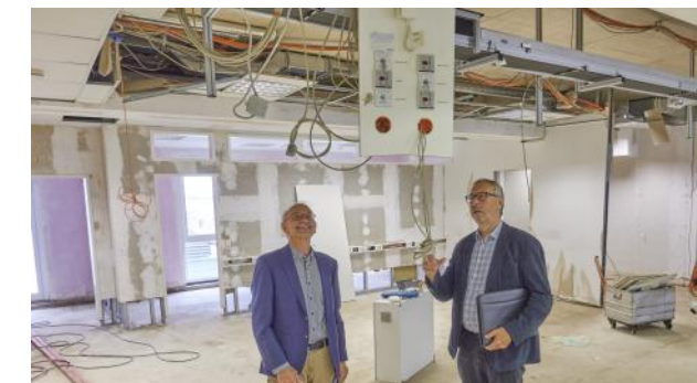
Wiederaufbau und Unternehmens-Expansion